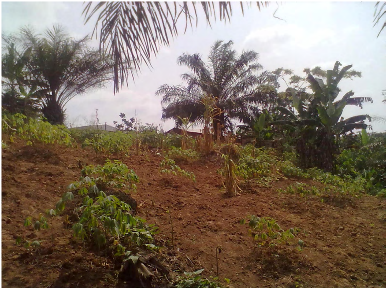
Das Grundstück für das Krankenhaus

Zusätzlich werden wir – wie auch in Deutschland üblich – eine Notstrom-Systematik in Form von Dieselmotoren einsetzen. Damit ist die lückenlose Stromversorgung selbst dann noch garantiert, wenn das Solar-System ausfallen sollte.