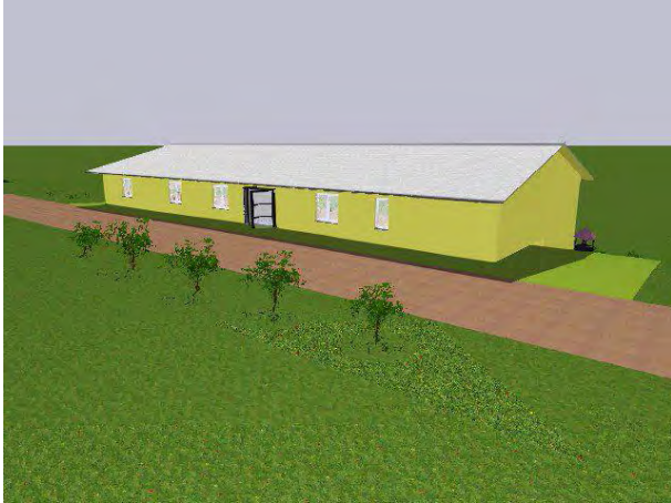
Von vorne (Straßenseite)

Es ist uns gelungen, ein ca. 600 Quadratmeter (15 x 40 Meter) großes Grundstück zu erwerben. Darauf soll ein Gebäude mit einer Grundfläche von ca. 400 Quadratmetern errichtet werden. Da das Grundstück an einem Hang mit ca. 3-4 Meter Höhenunterschied liegt, wird es nach hinten eine zusätzliche Etage geben.