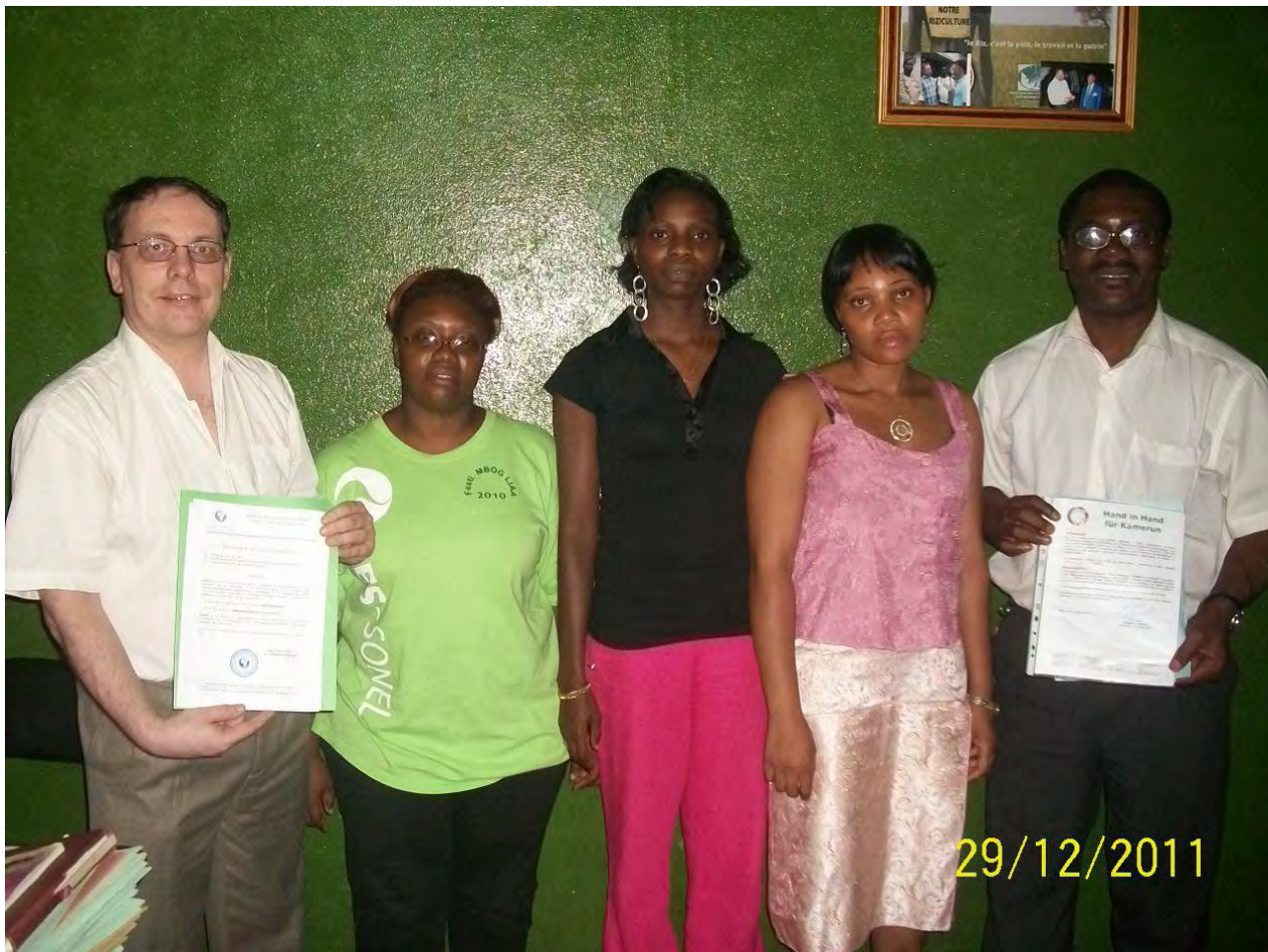
Übergabe der Repräsentanz-Urkunden

E-Mail: Cameroun@CEFOMECE.org Telefon: (nur französisch sprechend) +237 22084571 +237 99808240 +237 75924112